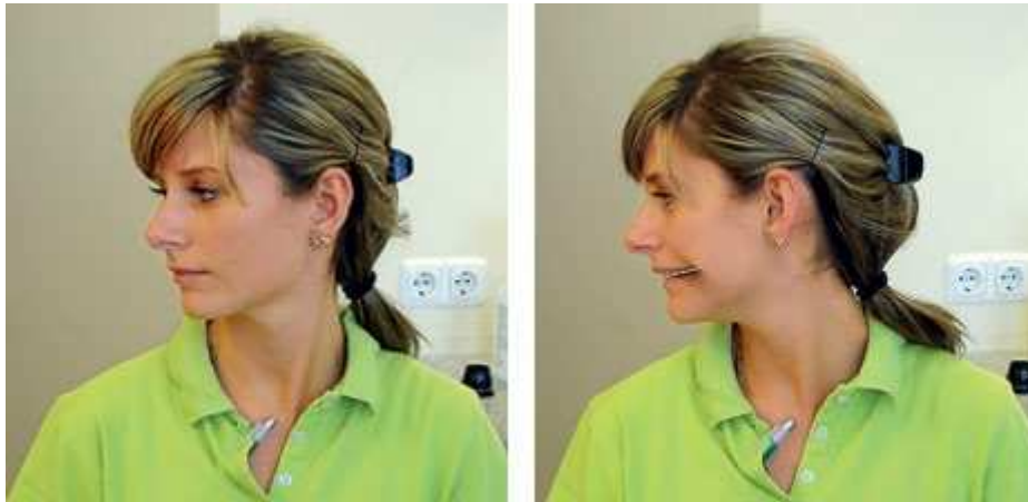
Spateltest : Die Kopfdrehung mit und ohne Spatel zeigt eine Abhängigkeit zwischen Okklusion und Halswirbelsäule.

Stunden. Fasst man diese beiden Punkte zusammen und schaut sich einen Bruxer an, der ohne Schwierigkeiten am Tag mehrere Stunden Zahnkontakt hat, dann ist es verständlich, dass es hier zu Problemen kommen kann. Diese können sich dann nicht nur bezüglich des stomatognathen Systems darstellen, sondern, aufgrund der Lagebeziehung zu den zwölf Hirnnerven, auch kiefergelenksfern sein.