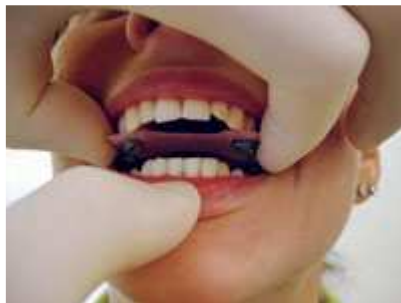
Zentriknahme durch den Zahnarzt

Anschließend erfolgt eine Überprüfung des Nervus trigeminus, Nervus facialis, Nervus glossopharyngeus, Nervus vagus und Nervus accessorius. Zuerst erfolgt ein Nervendehntest der oben genannten Nerven, in dem festgestellt werden soll, ob eine schmerzhafte Neuropathie oder eine schmerzlose neurodynamische Störung besteht. Eine solche neurodynamische Störung des Nervus mandibularis kann eine Mundöffnungsreduzierung von 0,5 bis 1,5 cm auslösen. Der Nervus mandibularis hat direkte kiefergelenksabhängige Irritationsstellen. Als häufigste ist die Irritation des Nervus temporo-auricularis in der bilaminären Zone zu beobachten. Durch eine Retralverlagerung des caput mandibularis kommt es zu einer Kompression des Nervens. Im Weiteren bestehen Einengungsrisiken des Nervus lingualis in der Loge des Musculus pterygoideus medialis.