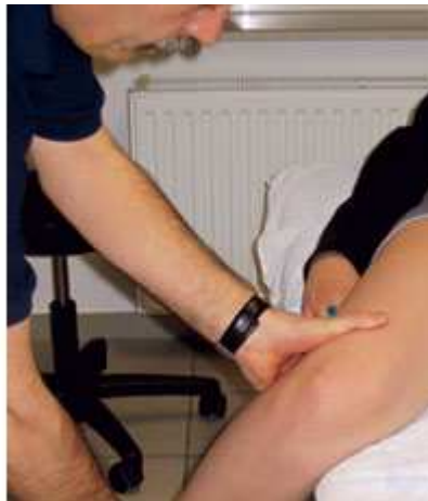
Downingtest: Prüfung der Beweglichkeit des Ileosacralgelenks (ISG)

Die folgenden Aufzählungen zeigen die relevantesten dieser Strukturen: